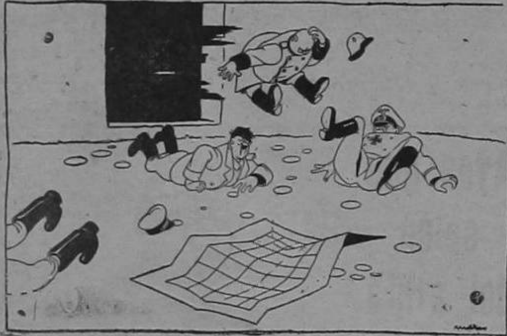
EL VIENTO SOPLA FUERTE DEL ESTE...

Los formularios deben ser remitidos a la siguiente dirección: Sección de Cultivo de Hule, Secretaría de Agricultura, San José.