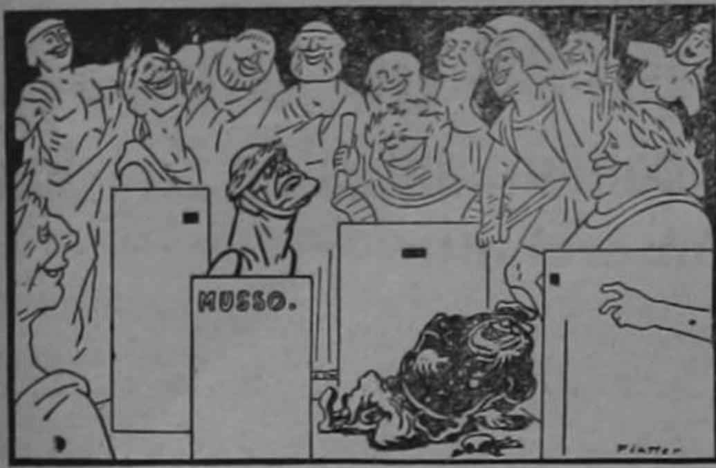
EL ULTIMO CESAR