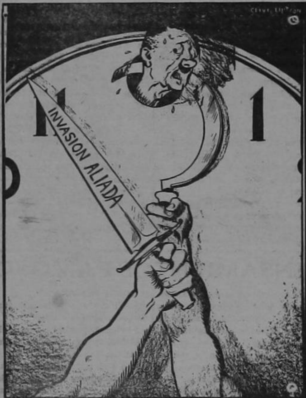
EL GOLPE DE GRACIA