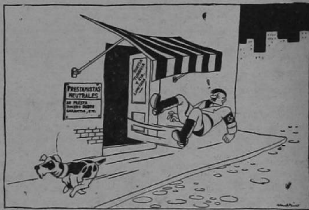
SU CREDITO NO ES BUENO